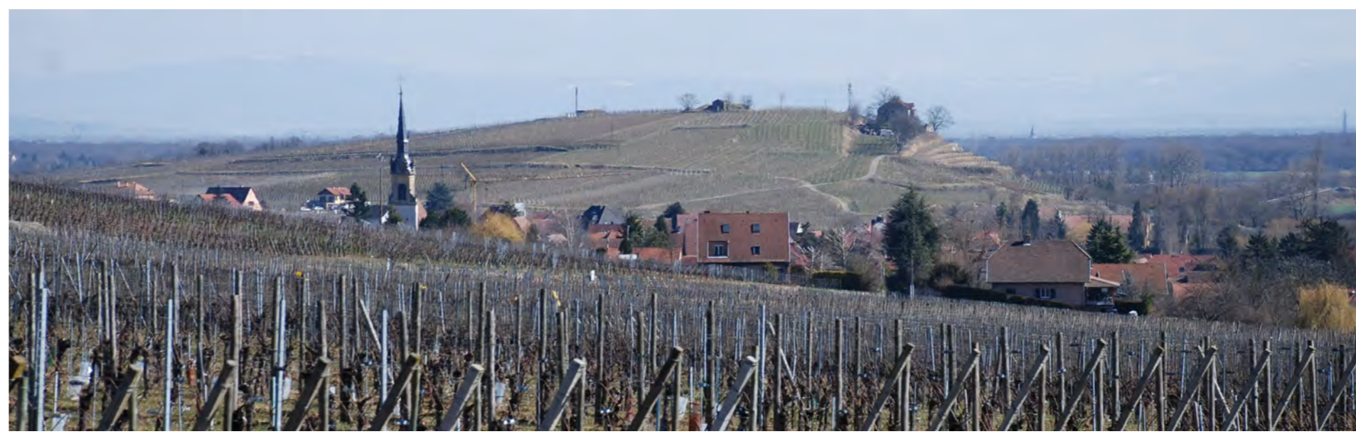
L'insertion du village au sein du paysage viticole. A l'arrière plan, l'Elsbourg