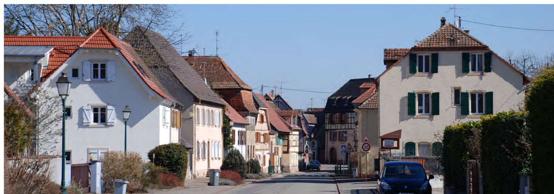
Entrée sud du village traditionnel