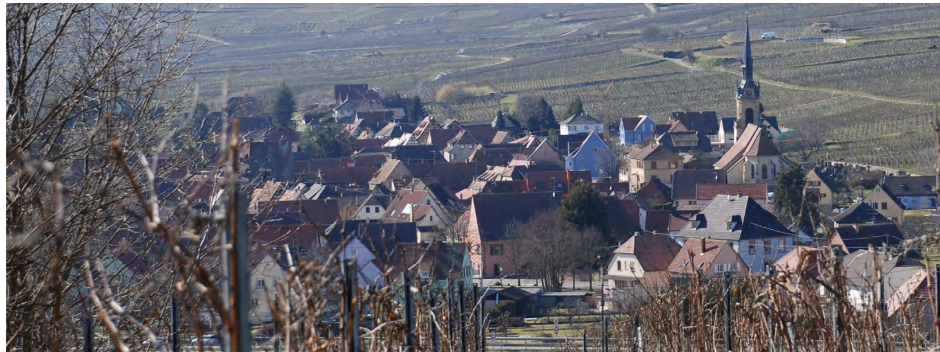
Le village traditionnel vu depuis l'Elsbourg