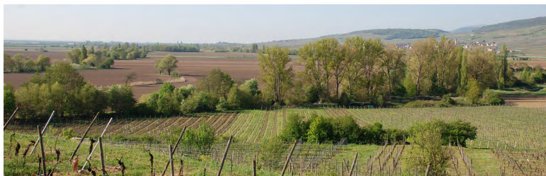
La plaine agricole et la ripisylve de la Lauch au pied de l'Elsbourg