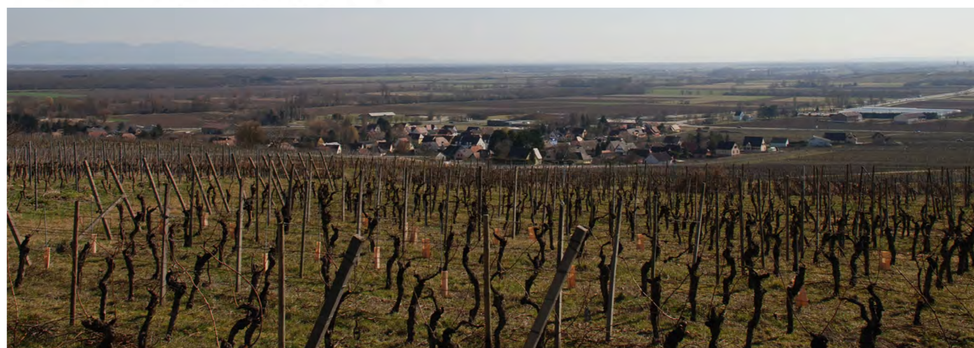
Le vignoble de Hattstatt et la plaine agricole à ses pieds

Hattstatt et la trame verte et bleue régionale, définie par le Schéma Régional de Cohérence Ecologique (SRCE - Extrait)