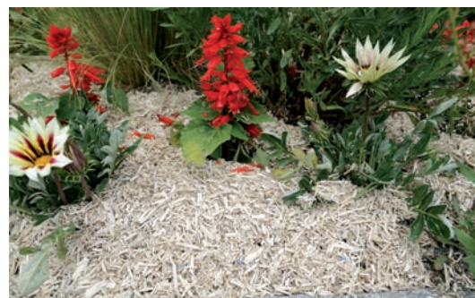
ex : paillage lin/chanvres