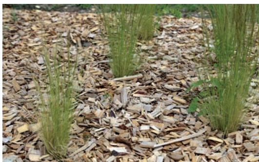
ex : paillage plaquettes de bois

- Les paillettes d'ardoise, la pouzzolane et les différents graviers (paillis minéraux) : très esthétique mais avec un coût plus élevé. A utiliser pour le paillage de graminées ou des plantes de terrains secs. Placer un voile géotextile avant l'épandage de ce type de matériau.